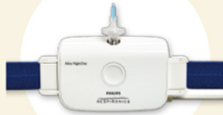
Alice Night One