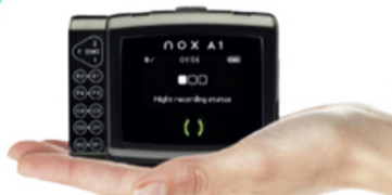
Nox A1S 纖巧便攜機身